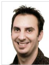
Thomas Biedermann SFS services AG CH-9435 Heerbrugg