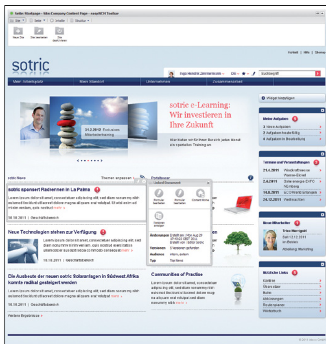
Abbildung: btexx easyWCM – Ansicht im Redakteurs-Modus

Ausschlaggebend für den Erfolg moderner Intranets, Websites oder Serviceportalen ist ein ausgefeiltes Web Content Management. Redakteure benötigen dafür intuitiv nutzbare Arbeitsmittel. Inhalte müssen komfortabel erstellt und dynamisch verwendbar sein.