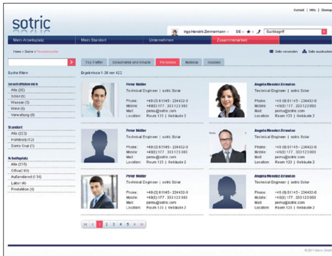
Abbildung: Suche nach Mitarbeitern mit der btexx universalSearch

Google & Co. sind das Mittel der Wahl, wenn es um die Suche nach Informationen im Internet geht. Diesen Komfort können Sie jetzt auch in Ihrem Unternehmensportal unter Nutzung bewährter SAP NetWeaver Portal Standards bieten.